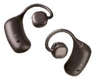
完全ワイヤレス nwm MBE001