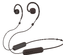
ネックバンドワイヤレス nwm MBN001