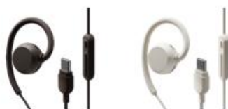
nwm WIRED (USB Type-C)

オープンイヤー型有線耳スピーカー「 nwm WIRED (USB Type-C) 」または「 nwm WIRED (3.5mm) 」