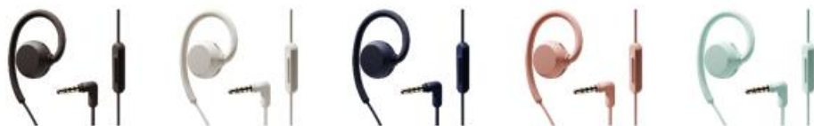
nwm WIRED (3.5mm)

※「nwm WIRED」のプラグは、2024 年 11 月に発売した口径 3.5mm もしくは、今回発売する USB Type-C よりお選びいただけます。またカラーバリエーションはお選びいただけませんのでご了承ください。